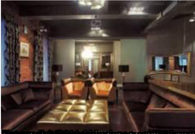
вводная информация по проекту в Олбейв Новым