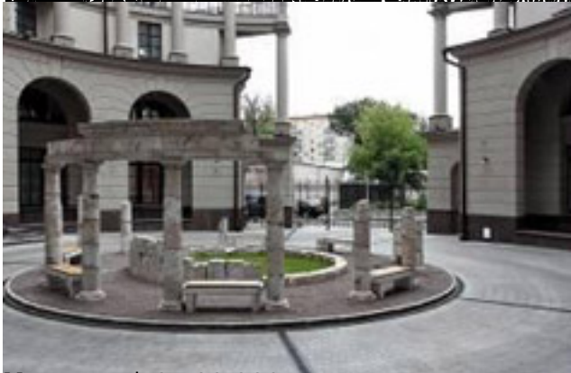
вводная информация по проекту в Олбейв Новым (7-8