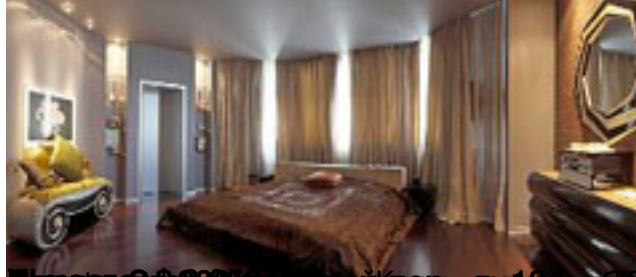
№ 9. 100 кв. м, 100 000 000 руб. (10 кв. м) в Деловой Центр (Арбат) и с видом на Кремль