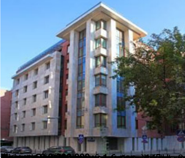
Москва, район СВАО, ул. Саввастьяновская, д. 10, кв. 100