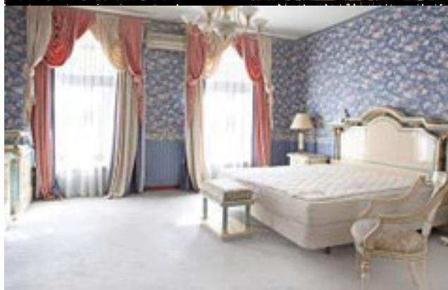
№ 8. 100 кв. м, 100 000 000 руб. (10 кв. м) в Деловой Центр (Арбат) и с видом на Кремль