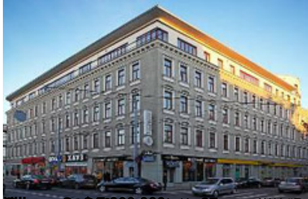
№ 7. 100 кв. м, 100 000 000 руб. (10 кв. м) в Деловой Центр (Арбат) и с видом на Кремль