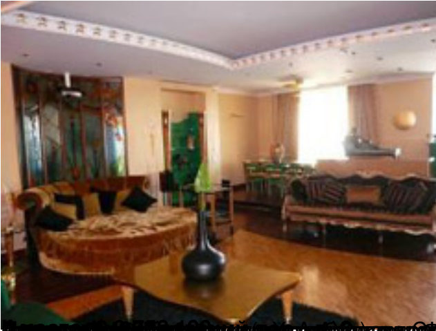
Москва, район ЮЗАО, ул. Саввастьяновская, д. 10, кв. 100