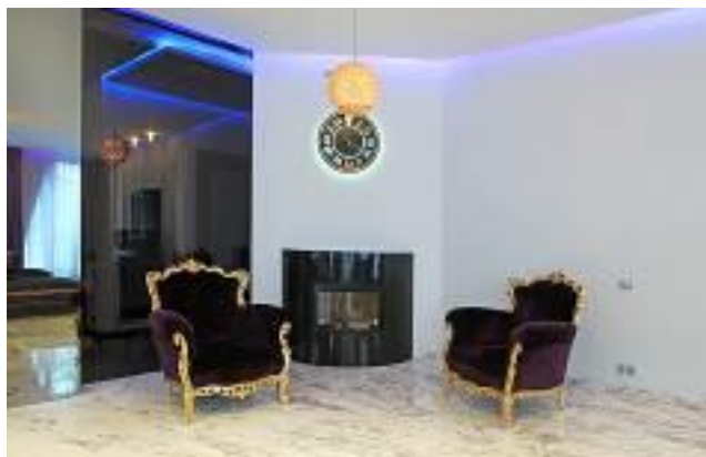
№ 10. 50 кв. м, 100 000 000 руб. (19 кв. м) в Деловой Центр (Арбат) и с видом на Кремль