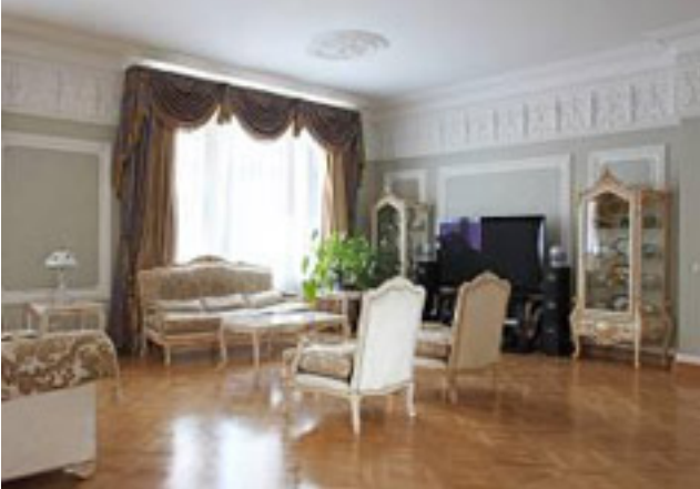
Москва, район СВАО, ул. Саввастьяновская, д. 10, кв. 100